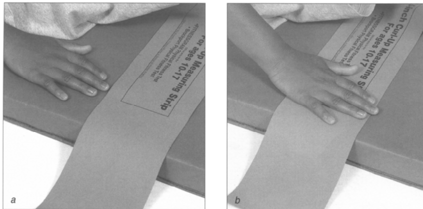
Figure A2-3 Curl-Up Finger Position / Position des doigts lors des demi-redressements assis

Note. From Fitnessgram / Activitygram: Test Administration Manual (3rd ed.) (p. 92), by The Cooper Institute, 2005, Windsor, ON: Human Kinetics. Copyright 2005 by The Cooper Institute. / Remarque : Tiré de Fitnessgram/Activitygram: Test Administration Manual (3rd ed.) (p. 92), par The Cooper Institute, 2005, Windsor, Ont. : Human Kinetics. Copyright 2005 The Cooper Institute.