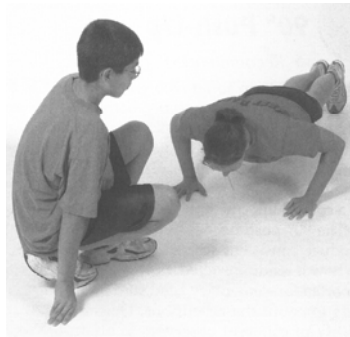
Figure A3-2 Down Position of the Push-Up / Pompe - Phase basse avec les bras à 90 degrés

Windsor, ON: Human Kinetics. Copyright 2005 by The Cooper Institute. / Remarque : Tiré de Fitnessgram/Activitygram: Test Administration Manual (3rd ed.) (p. 92), par The Cooper Institute, 2005, Windsor, Ont. : Human Kinetics. Copyright 2005 The Cooper Institute.